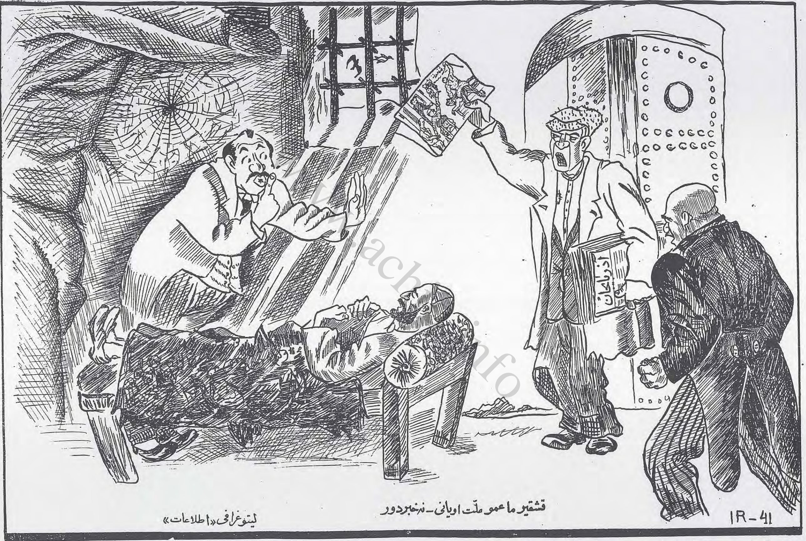
قشیر ما عمو ملت او یانی - نخبردور